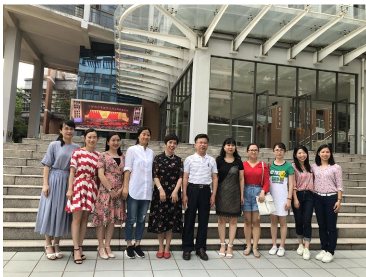
图 4. 课题组成员与东莞中学松山湖学校领导合影

活动最后，参加研讨会的市名师、课题组核心成员与东莞中学松山湖学校的校领导进行了合影留念，本次研讨活动顺利结束。